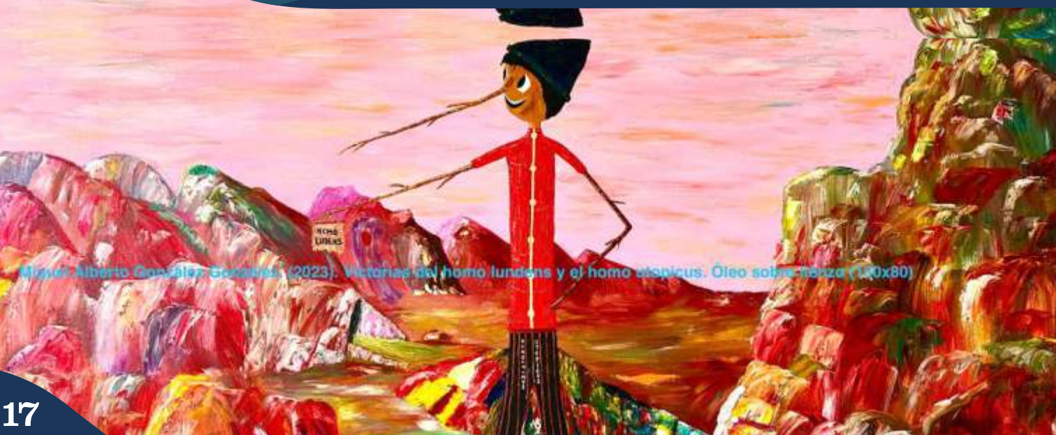
Miguel Alberto González Granados (2023). Victoria del hombre lujeros y el hombre ciego. Óleo sobre tela (120x80)